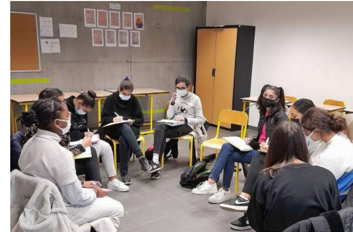
Ci-contre, différentes actions école