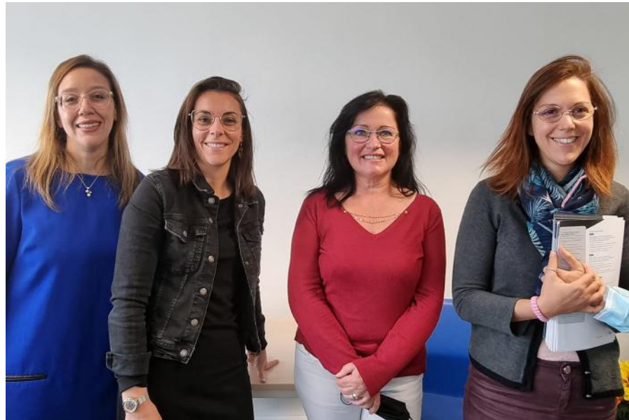
La nouvelle équipe nazairienne