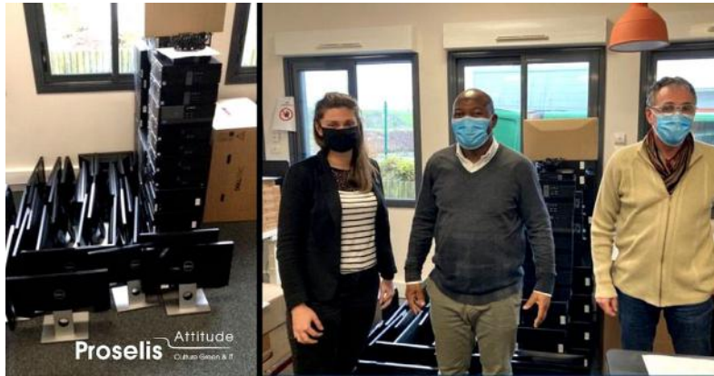
Don d'ordinateurs (ci-dessus)